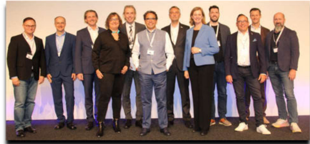
(Referent:innen Logistik-Forum Graz 2024)